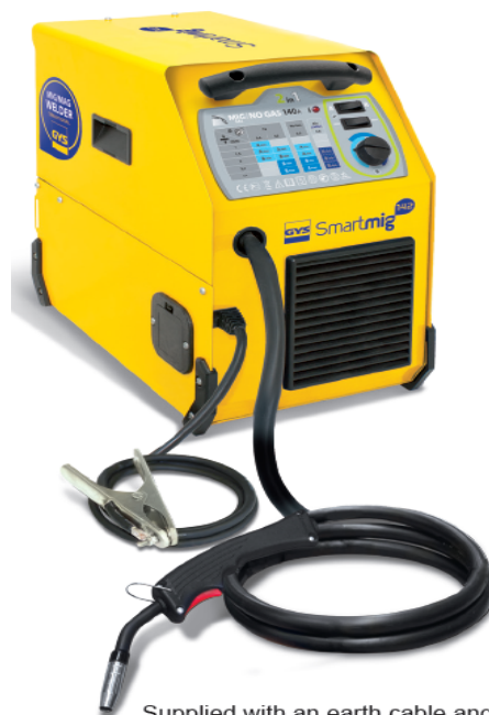
Supplied with an earth cable and a 2.2m fix torch.

Konstantno uključen ventilator štiti od pregrevanja