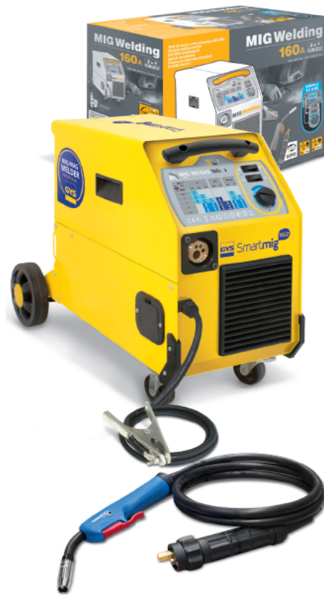
Earth Clamp and 2.2m EURO torch included.

Konstantno uključen ventilator štiti od pregrevanja