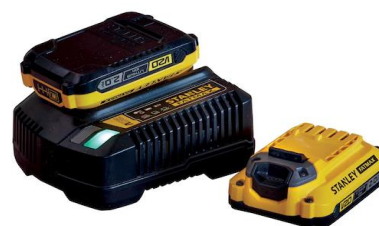
SFMCB12D2-QW SET PUNJAČ+2 BATERIJE V20-18V