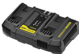
SFMCB24-QW DUPLI PUNJAČ V20 V20-18V