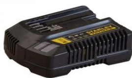
SFMCB14-QW PUNJAČ V20 SERIJE V20-18V

Vreme punjenja: 2,0Ah – 30 min 4,0Ah – 60 min